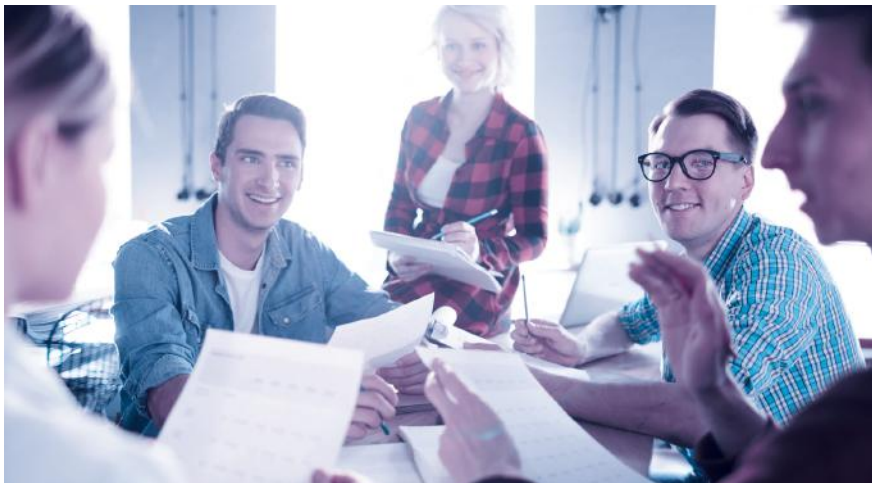
Aktionärbündungsvertrag: ein sinnvolles Instrument, um in guten Zeiten vorausschauende Regelungen für schwierige Phasen zu definieren.

Fast alle Aktionärbündungsverträge sehen Veräusserungsbeschränkungen vor, gerade in Familienbetrieben und Aktiengesellschaften mit wenigen Aktionären. Beispielsweise erwirbt man mit einem Kaufrecht das Recht, Aktien zu erwerben, ohne dass die Zustimmung der anderen Partei erforderlich wäre. Das kann sinnvoll sein, wenn ein Unternehmensaktionär bei der Gründung nicht das ganze Aktienkapital aufbringen kann, aber später den Anlegeraktionär auskaufen will. Vorhandrechte wiederum verpflichten dazu, seine Aktien der anderen Partei anzubieten, bevor ein Vertrag mit einem Dritten abgeschlossen wird. Ein Vorkaufsrecht berechtigt dazu, anstelle eines Dritten zu den Konditionen,